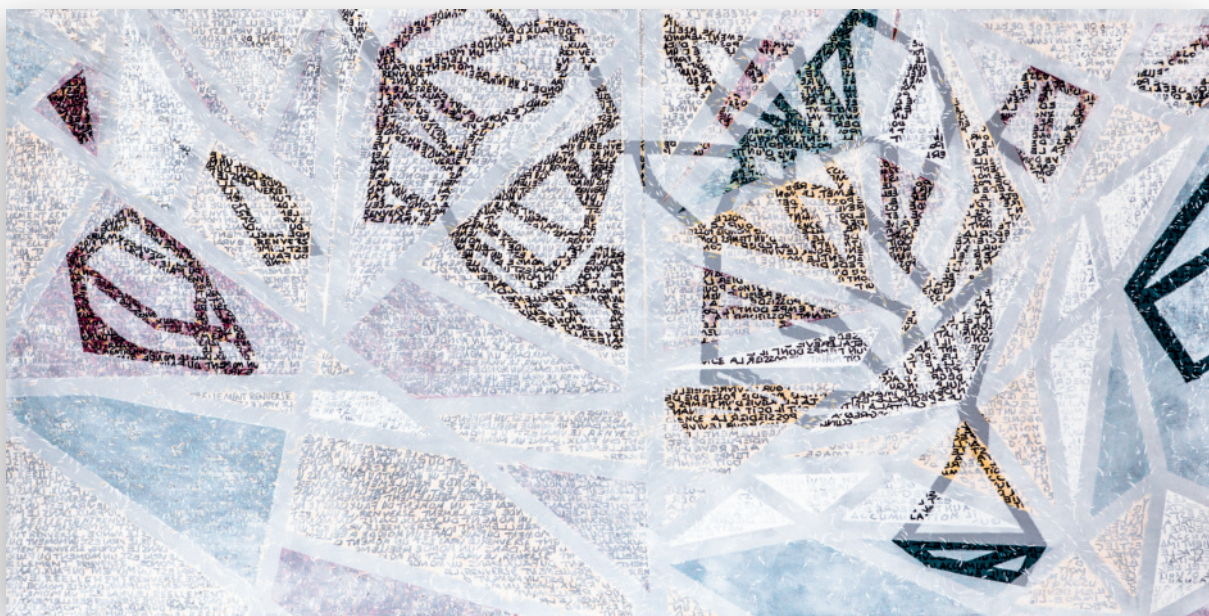
untitled 2 (Le vrai est un moment du faux) - 2016 Acrylic & indelible felts 82.2 × 165.3 cm