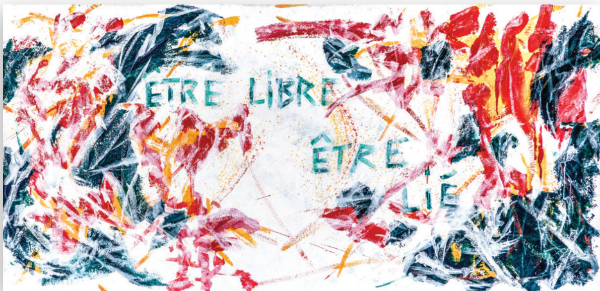
untitled 5 (#librelié #freifreund #freefriend) - 2017 Acrylic & indelible felts 82 × 170 cm